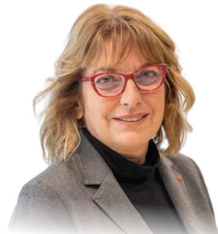
Presidente: Cécile de Saint Michel